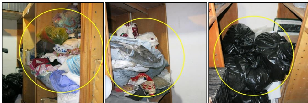
شکل ۲: طرز قرارگیری لباس‌های مردم‌شناسی داخل مخزن